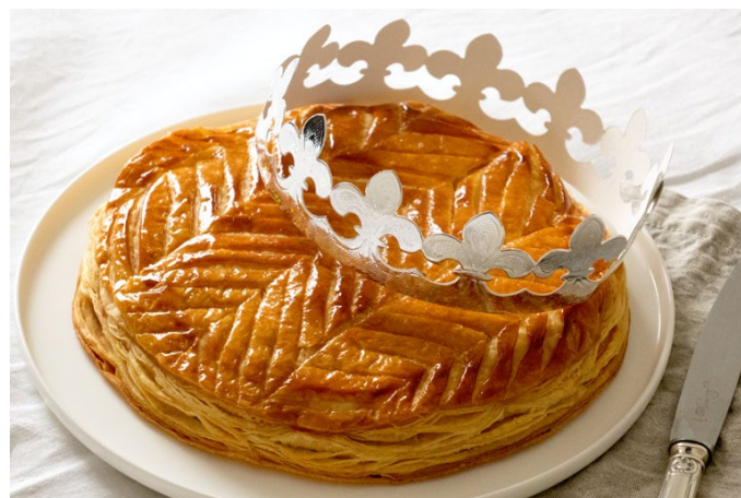
Galette à la frangipane